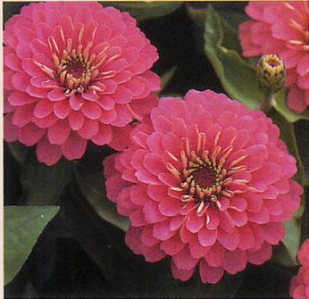
2 F1ドリームランド ピンク