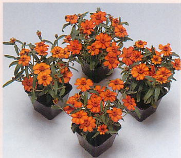
プチランド オレンジ