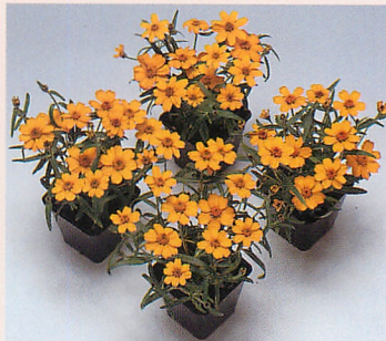
プチランド イエロー