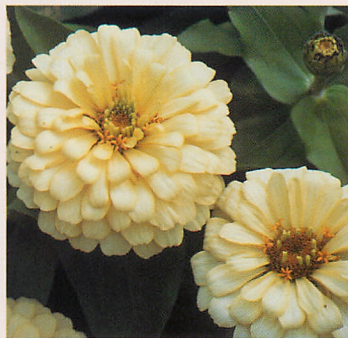
5 F1ドリームランド アイボリー