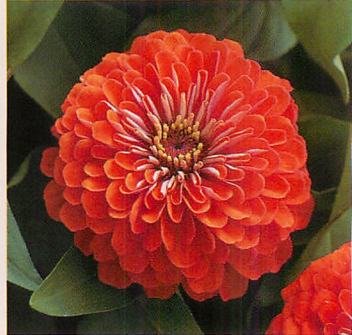
4 F1ドリームランド コーラル