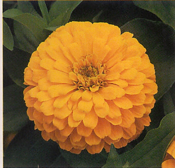
3 F1ドリームランド イエロー