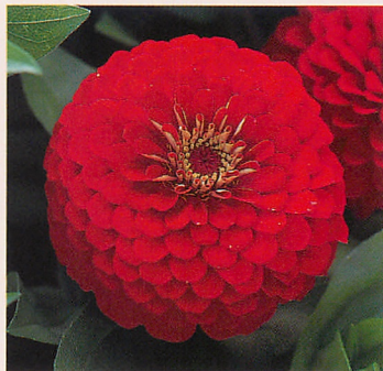
7 F1ドリームランド カーマイン