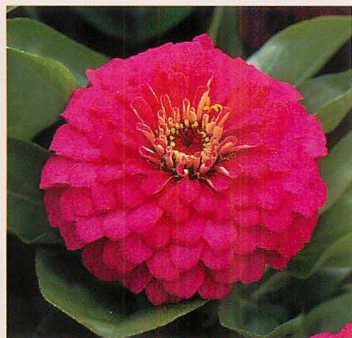
6 F1ドリームランド ローズ