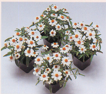
プチランド ホワイト