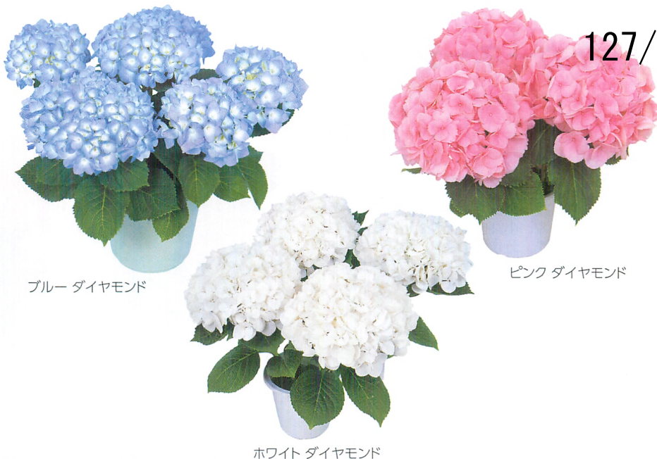
ブルー ダイヤモンド

増殖用母株 各色 72穴 保証本数=70本 290円/本(税抜) (最小販売数量 1品種 70本)