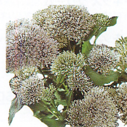
パッション イン ホワイト