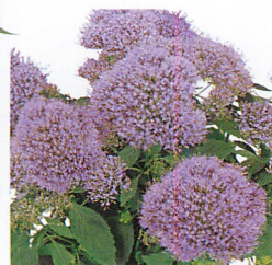
パッション イン ライラック