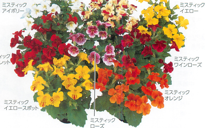
ミスティック アイボリー