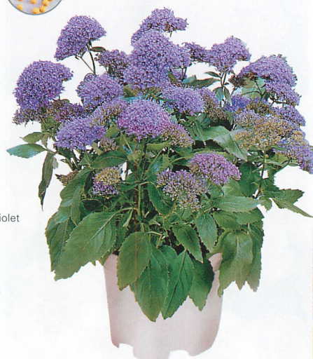
パッション イン バイオレット