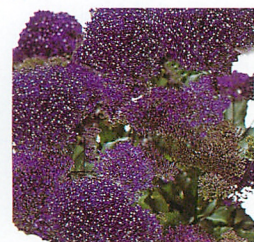
パッション イン ディープパープル