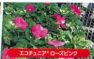
エコチュニア® ローズピンク