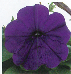
エコチュニア® ブルー