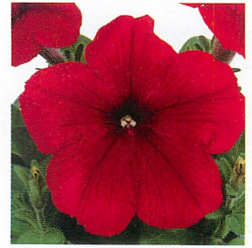
エコチュニア® レッド