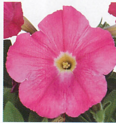
エコチュニア® ローズピンク