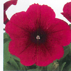
エコチュニア® チェリーローズ