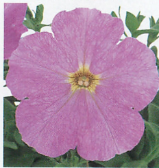
エコチュニア® ライラック