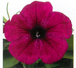
エコチュニア® バーガンディー