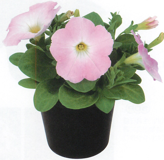
エコチュニア® ラベンダーピンク