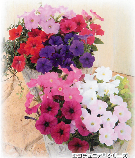
エコチュニア® シリーズ

※播種日：2011年11月4日(設定温度25℃)、移植日：2011年12月12日(設定温度5℃)