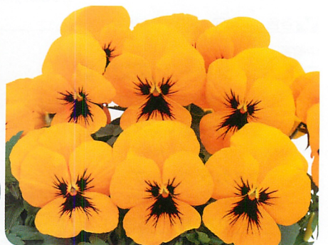
よく咲くスマレ マロン