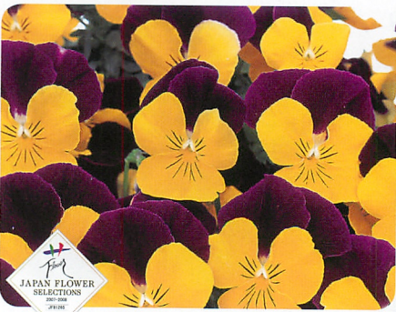
よく咲くスマレ スイートポテト