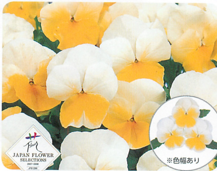
よく咲くスマレ レモネード