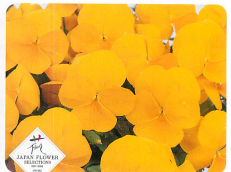
よく咲くスマレ パイナップル