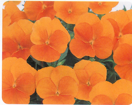
よく咲くスマレ マーマレード (ver.2)