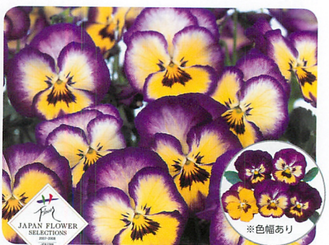
よく咲くスマレ ブルーベリーパイ