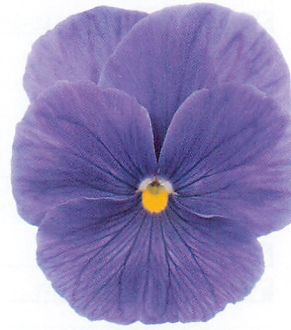
パシオ® クリアブルー