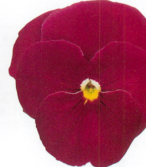
パシオ® クリアローズ