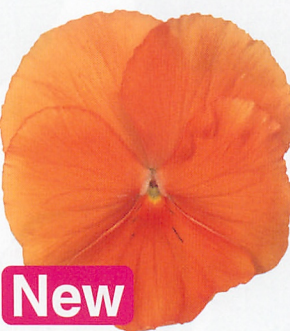
パシオ® クリアオレンジ (ver.2)