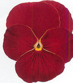
パシオ® クリアスカーレット