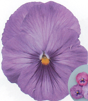
パシオ® クリアラベンダー

Passio Black ブラックから濃い青紫色。従来種に比べ、花上りがよく開花性に優れ、弁質がよく、株ができコンパクトです。※栽培環境により、花色の濃淡や、マークが入るものが発生します。