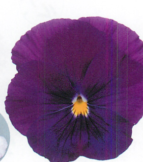
パシオ® クリアパープル