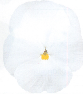
パシオ® クリアホワイト