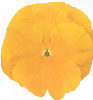
パシオ® クリアイエロー