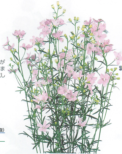
ペデル シェルピンク