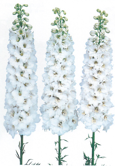
キャンドル ホワイト