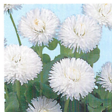
チロリアンデージー® ヨーゼフ