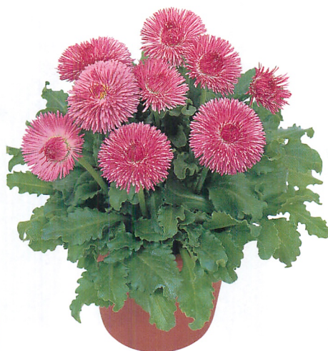
チロリアンデージー® クララ