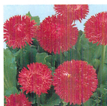
チロリアンデージー® ハイジ