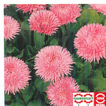
チロリアンデージー® ロベラ