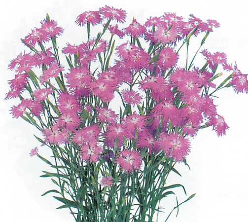
ミーティア ローズピンク