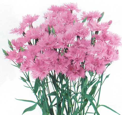
ダブルエレガンス ピンク