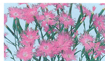
ミーティア ピンク