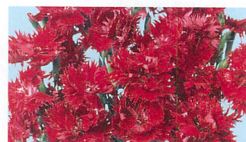
ダブルエレガンス レッド