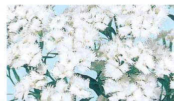
フォトン ホワイト (ver.2)