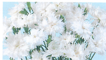
ダブルエレガンス ホワイト