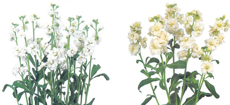
スパーク ホワイト2