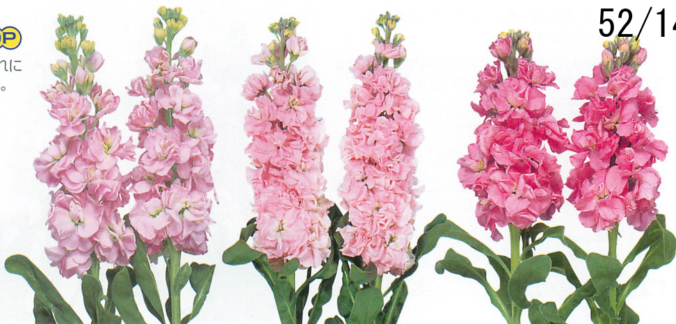
アイアン チェリー

*「アイアン」は早生～中生、「アーリーアイアン」は極早生～早生、「キッド」は極早生品種です。「アイアン」を基準とした早晩性の差になります。