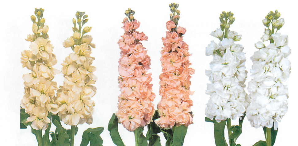
アイアン イエロー