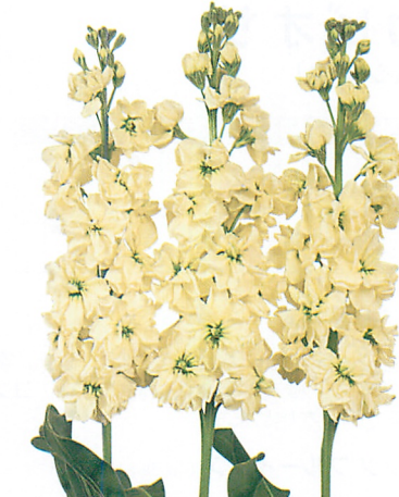
レボリューション イエロー2