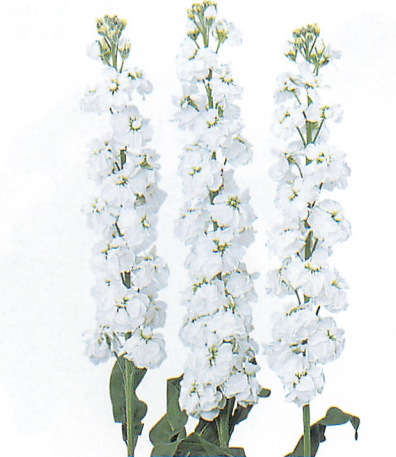
レボリューション ホワイト2