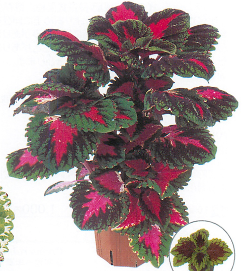
(大鉢栽培の苗姿) ゴリラ® レッド (出荷時の苗姿)