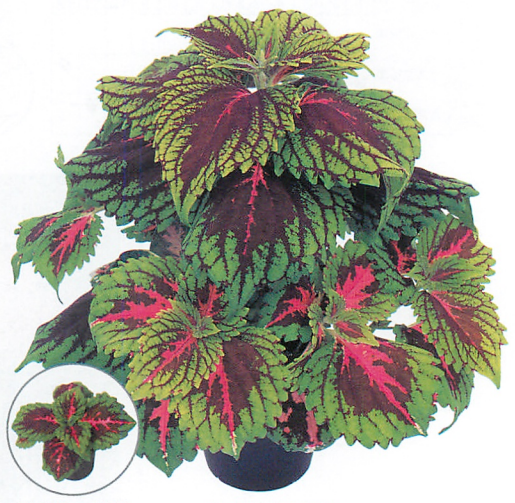
(出荷時の苗姿) (大鉢栽培の苗姿) ゴリラ® サーモンピンク