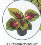
(出荷時の苗姿) (大鉢栽培の苗姿) ゴリラ® ローズ