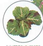
(出荷時の苗姿) (大鉢栽培の苗姿) ゴリラ® モザイク