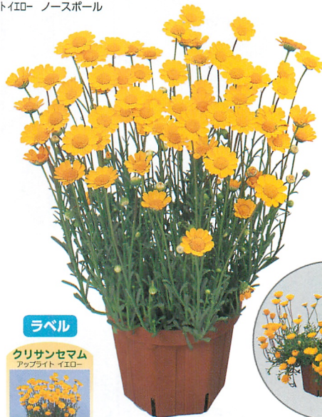
アップライト イエロー