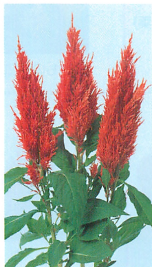
センチュリー ファイヤー