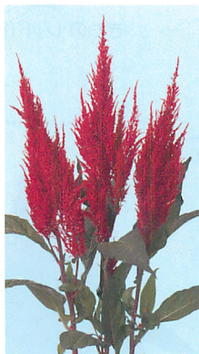
センチュリー レッド