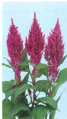
センチュリー ローズ