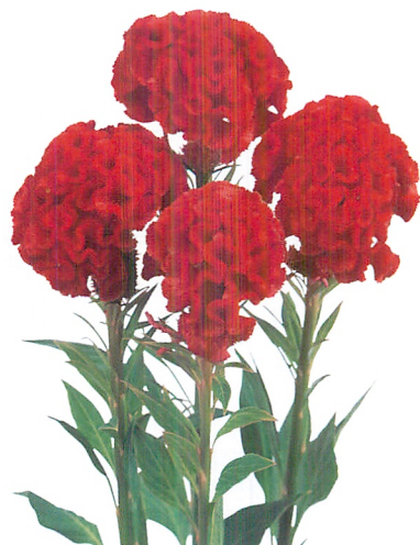
ファイアリーレッド