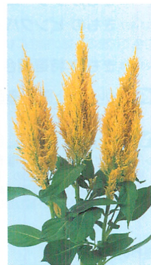
センチュリー イエロー