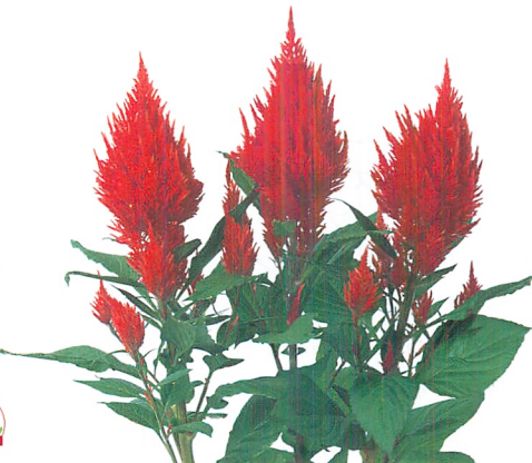
スカーレット マスコット