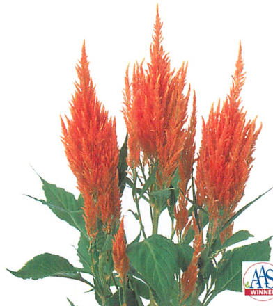
アプリコット ブランデー