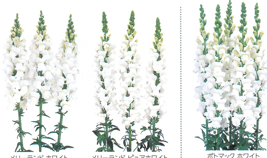
メリーランド ホワイト