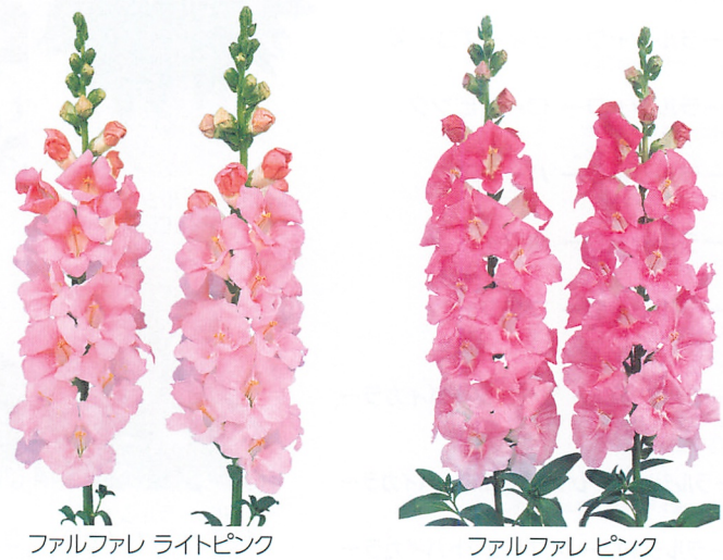
ファルファレ ライトピンク