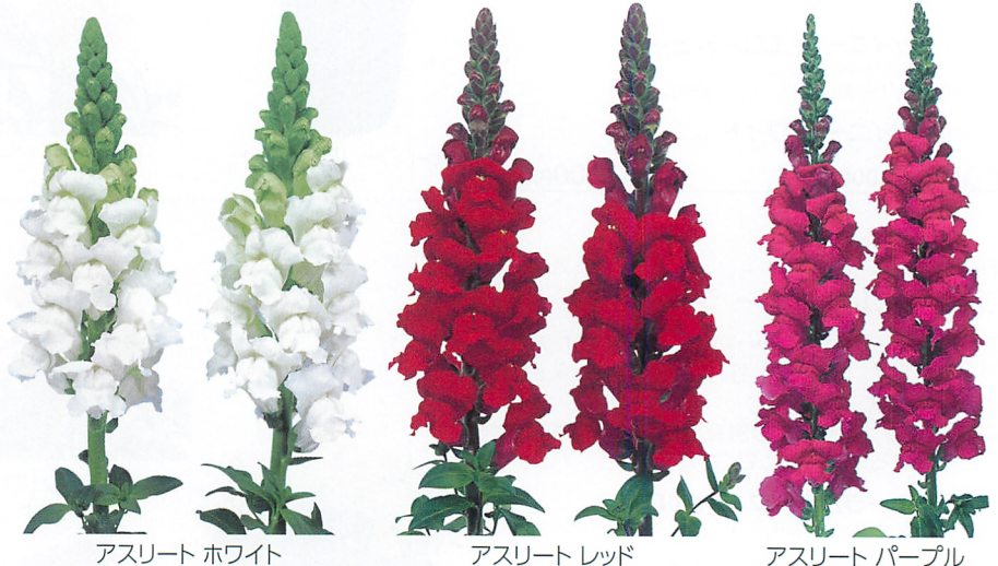
アスリート ホワイト