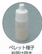
ペレット種子 お届け見本