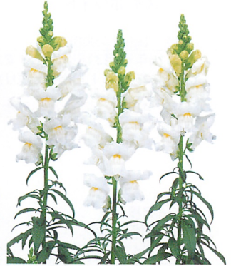
スピーディーソネット ホワイト (ver.2)