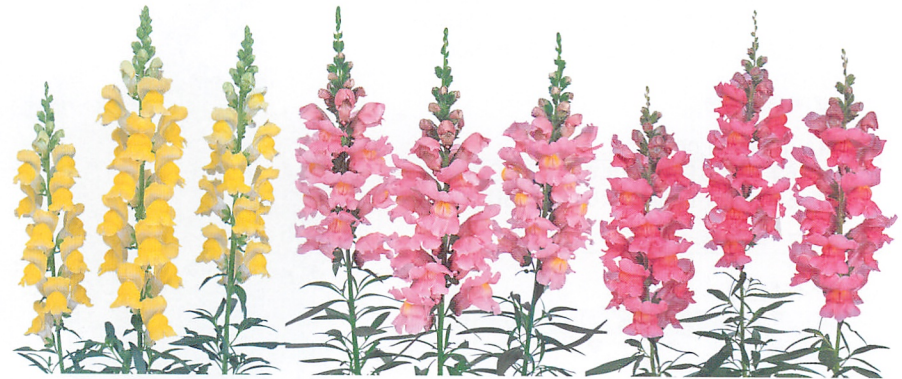
ソネット イエロー