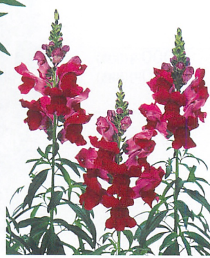
スピーディーソネット クリムソン