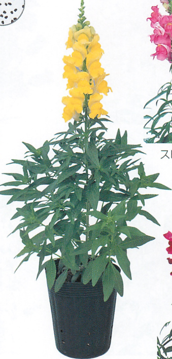
スピーディーソネット イエロー