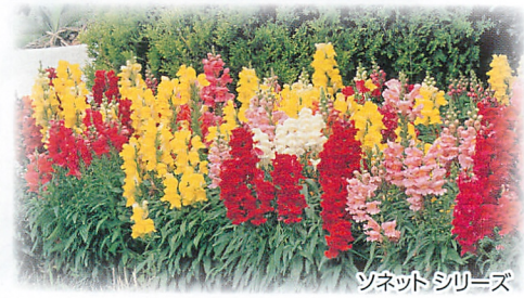
ソネット シリーズ