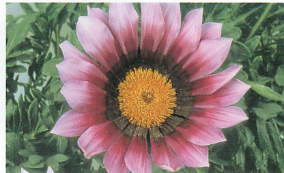
ニューデイ ピンクシェード