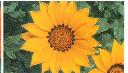
ニューデイ イエロー