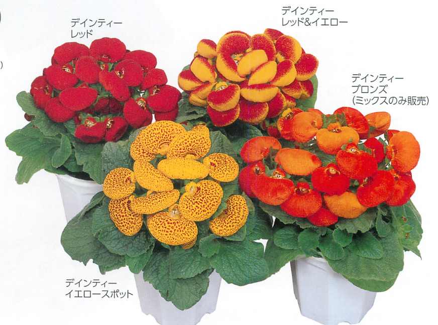
デインティー レッド