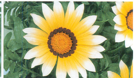
ニューデイ ホワイト