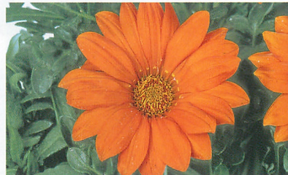
ニューデイ クリアオレンジ