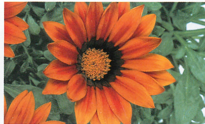
ニューデイ ブロンズシェード