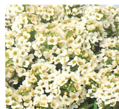
イースターボネット レモネード