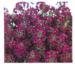
イースターボネット バイオレット