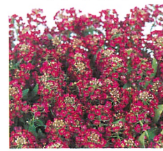
イースターボネット ディープローズ