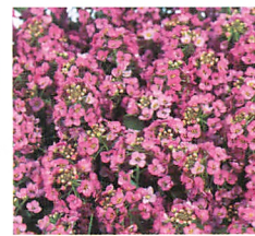
イースターボネット ディープピンク