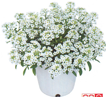
スノー クリスタル