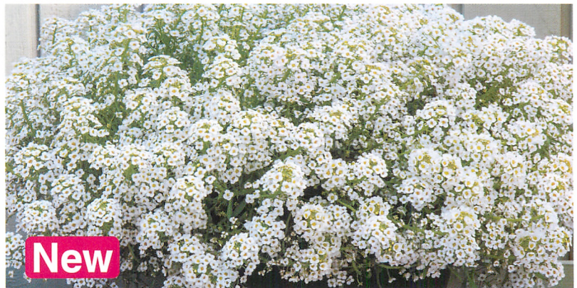
ノースフェイス ホワイト