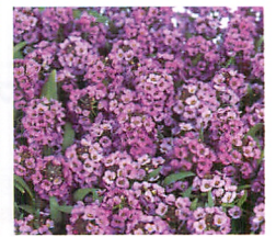
イースターボネット ラベンダー