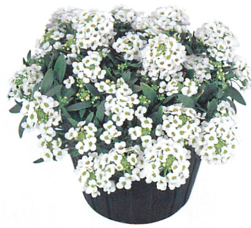
イースターボネット ホワイト