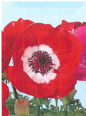
ポルト スカーレット

トレー規格 288穴 苗サイズ 本葉3~4枚 *写真は目安で品種等により苗の大きさは異なります。