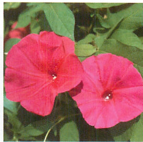
スカーレットオハラ