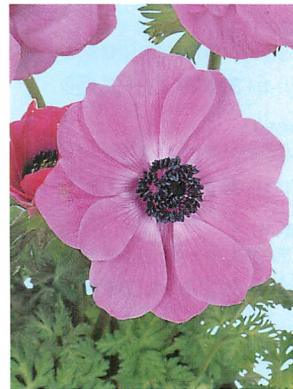
ポルト オーキッド