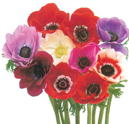
モナリザ 特選混合