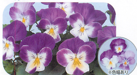
よく咲くスマレ ラベンダーソフト 明るい色合いのユニークカラー