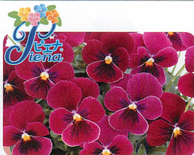
ピエナ® ローズブロッチ 濃い桃色に黒のブロッチカラー