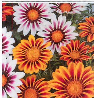
ニューデイ タイガーマックス ストライプカラーの混合