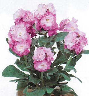
ベイビー ピンクフラッシュ 咲き進むにつれ濃いピンク色に変化