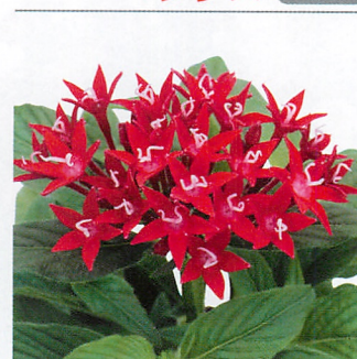
グラフィティー レッドベルベット 安定の発色のレッド