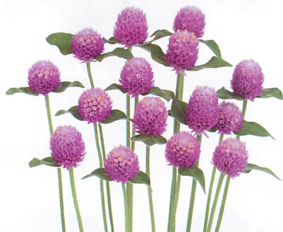
ネオン ラベンダー 茎がかたく、切り花にも向く中高性品種