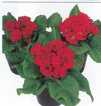
クラウディア ディープスカーレット (ver.2) より早生で、シリーズの開花が揃う