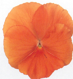
パシオ® クリアオレンジ (ver.2) 多花性で、より株張りがよい