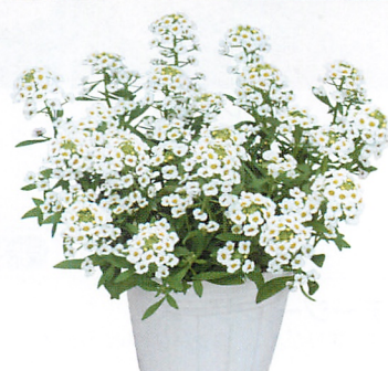
ノースフェイス ホワイト 4倍体品種で生育旺盛