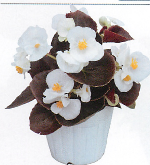
セネティQ ホワイト コンパクトで多花性になった改良系