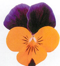
ソルベXP オレンジジャンプアップ 花形、花色を改良