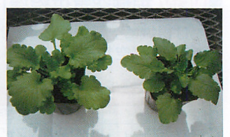
パンジー普通育苗(左) 104/106