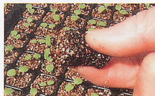
パンジーの稚苗移植が可能