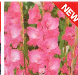
フェアリーテイルピンク®

花柄大輪 早晩性 早中生 草丈(cm) 125~145 【適正作型】 促・抑 【品種特性】