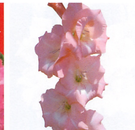
フレボエフェクト®

花柄大輪 早晩性 中生 草丈(cm) 130~150 【適正作型】 促・季・半抑制 【品種特性】