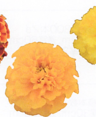
ホットパック ゴールド