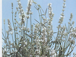
エレガンス アイス