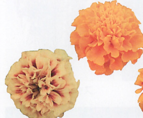
ホットパック ファイヤ