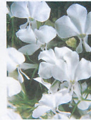
リビエラ ホワイト