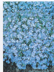
リビエラ スカイブルー