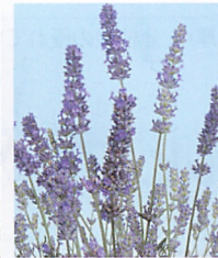
エレガンス スカイ