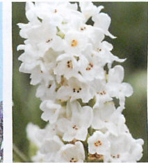
エレガンス スノー