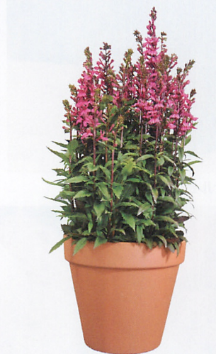
スターシップディーブローズ