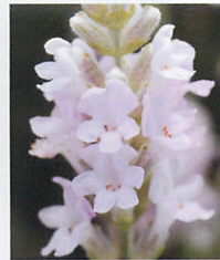
エレガンス ピンク