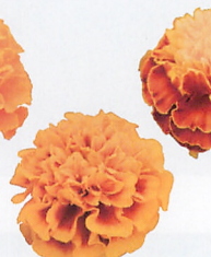
ホットパック フレーム