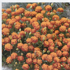
モーグリ バイカラー