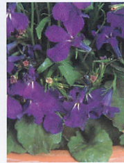
リビエラ マリブルー