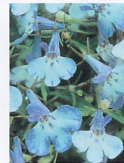
リビエラ ブルースプラッシュ