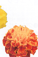
ホットパック ハーモニー