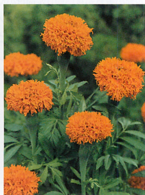
プロミス オレンジ