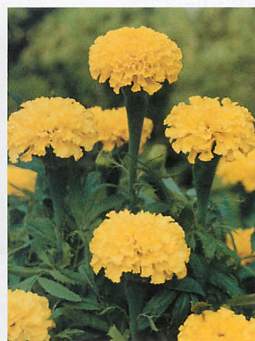
プロミス イエロー