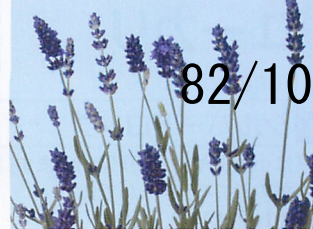
エレガンス パープル