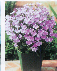
リビエラ ライラック