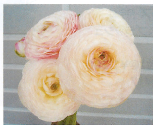
ミスティー ピンクフラッシュ