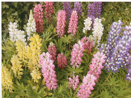
ミニギャラリー混合