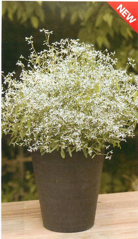
ユーフォルビア F1グリッツ PVP