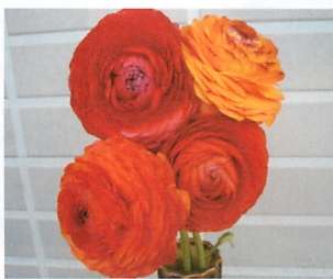
ミスティー ファイヤー