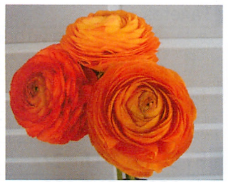
ミスティー アプリコットオレンジ