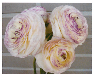
ミスティー ブルーピコティー