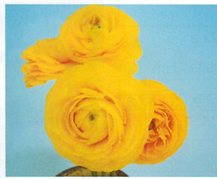
ミスティー イエロー