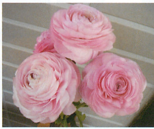
ミスティー ライトピンク