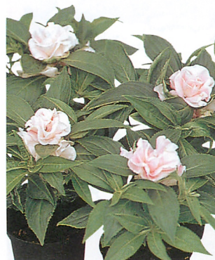
トップノット ローズ