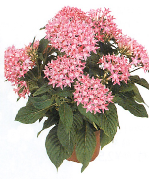
グラフィティ ピンク