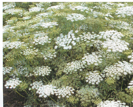
ホワイトレースフラワー グレースランド