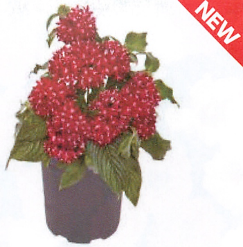
グラフィティ レッドベルベット