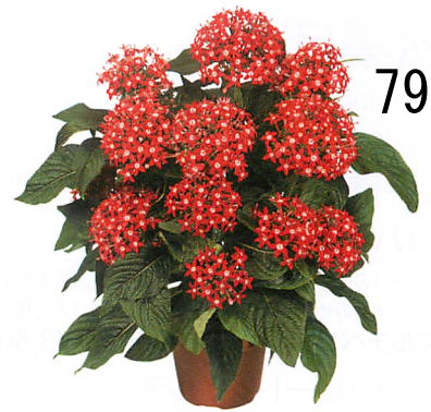
グラフィティ ブライトレッド