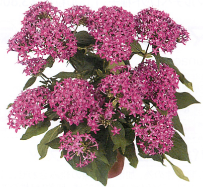
グラフィティ バイオレット