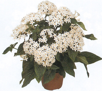
グラフィティ ホワイト