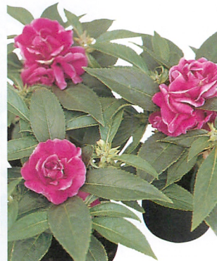
トップノット バイオレット