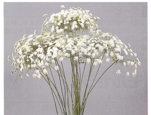
ホワイトレースフラワー

目次 新品種紹介 草花 お助の商品 ユーストマ お助の商品 ピオラ お助の商品 ハンジ ア カ サ タ ナ ハ マ ヤ ラ ワ MSプラ 栄養系苗 野菜種子 球根&吊物 資材 取引先