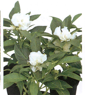
トップノット ホワイト