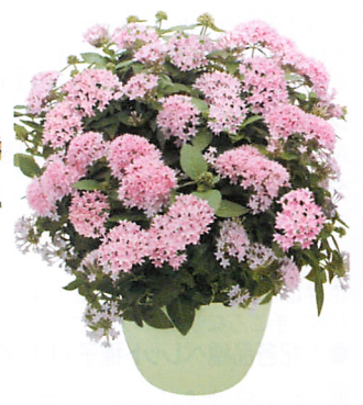
グラフィティ ラベンダー