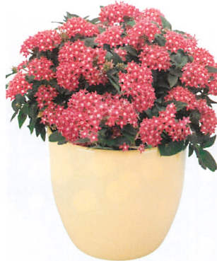
グラフィティ ローズ