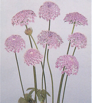
ブルーレースフラワー ブルー