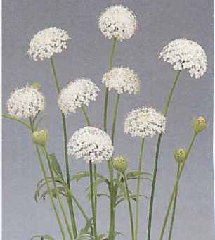
ブルーレースフラワー ホワイト