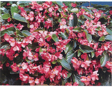
ドラゴンウイング ピンク

栄養系品種よりも格段に発根活着しやすい観葉ベゴニア、従来の斑入り品種に比べて条件の良くない環境でもストレスを受けにくい品種です。 ●マルチペレット種子(100粒)@¥2,500