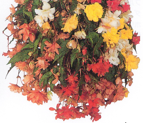
F1イルミネーション 混合