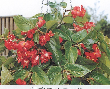
ドラゴンウイング レッド