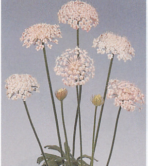
ブルーレースフラワー ピンク