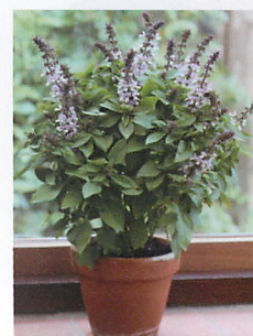
フローラルスピアー ラベンダー