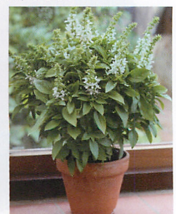
フローラルスピアー ホワイト