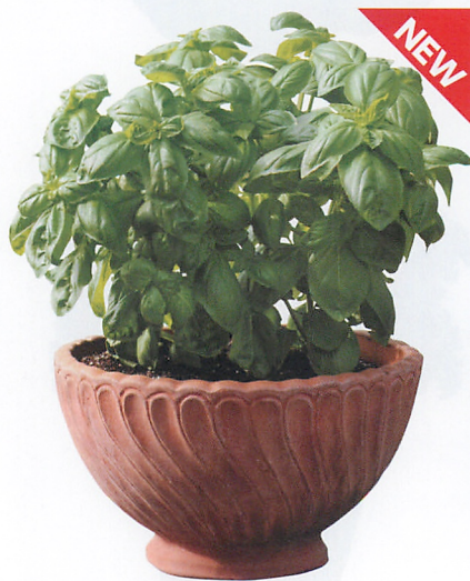
ドルチェフレスカ