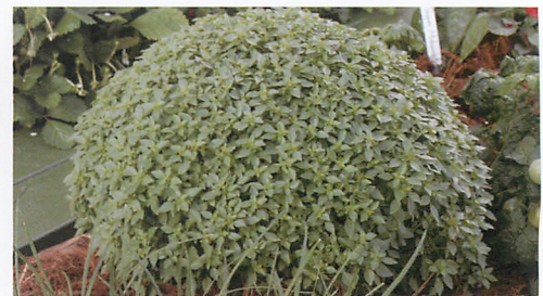
バジリアルストテレス