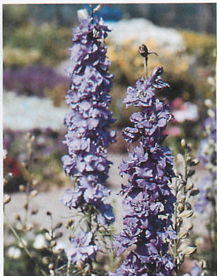
サンシャイン ライラック