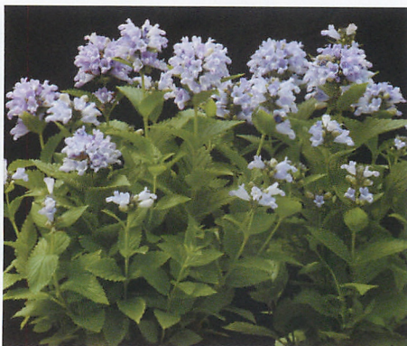
ブルーパンサー APPROVED NOVELTY