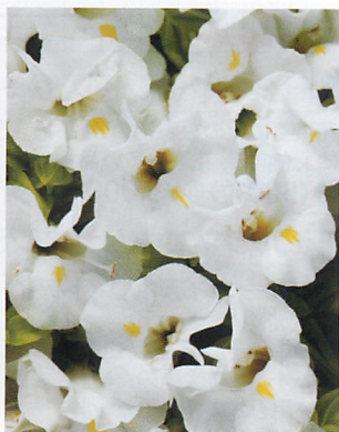
カウアイ ホワイト