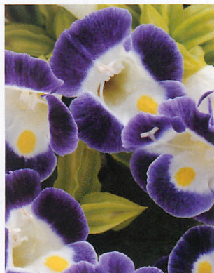
カウアイ ブルーアンドホワイト