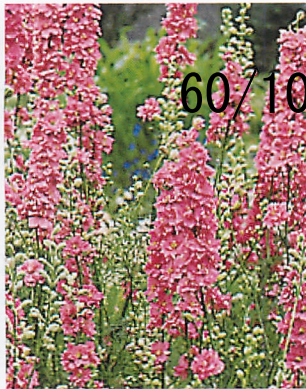
サンシャイン ローズ