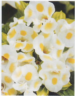
カウアイ レモンドロップ