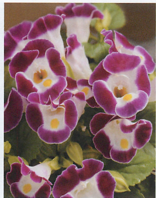
カウアイ バーガンディー