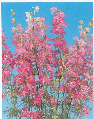
サンシャイン カーマインローズ