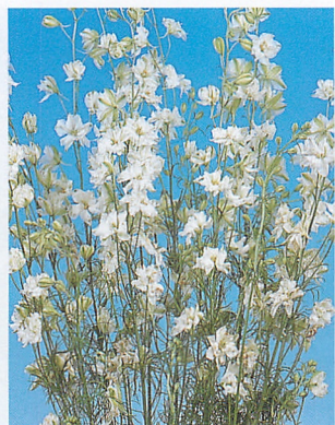
サンシャイン ホワイト