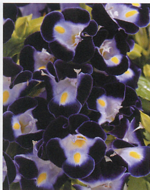
カウアイ ディープブルー