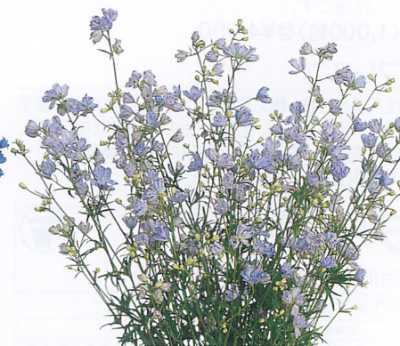
クリスタルラベンダー