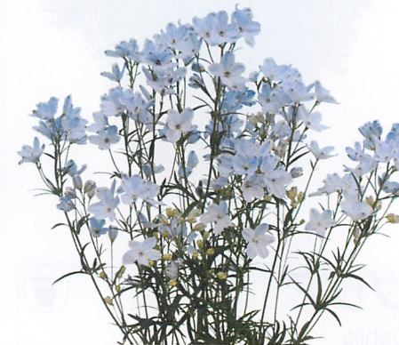
F1ファッションスカイ