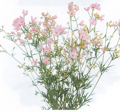
クリスタルピンク