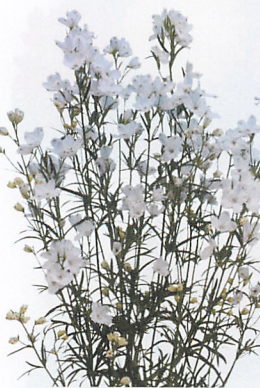
F1トットリートールスカイ