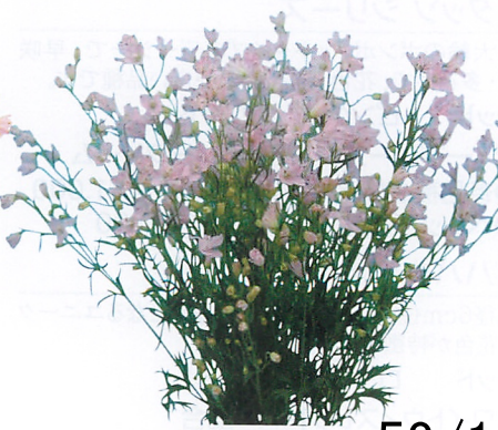
クリスタルネオピンク