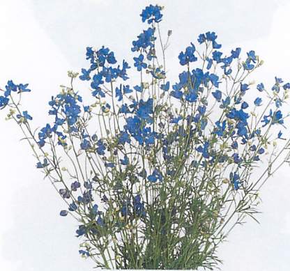
クリスタルブルー