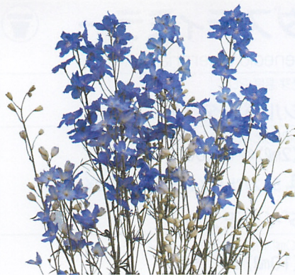
F1ファッションマリン

寒高冷地の5~6月定植8~9月採花向けの晩生品種。ブルー、スカイ、ホワイトについては限定販売とさせて頂いております。詳しくは、本社・営業担当者までお問い合わせ下さい。