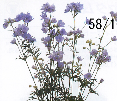
F1ファッションラベンダー