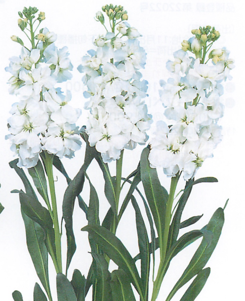
ホワイトマウンテン