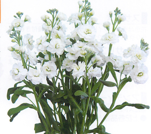
オールダブル スノーフォ 48/106

暖地での早播きは茎が太くなり開花が遅れる事があります。暖地の彼岸出しにオススメです。