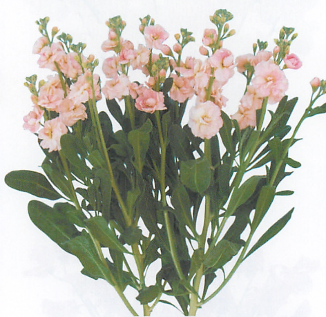
シャンテ アプリコット