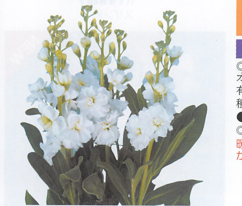
シャンテ ピュアホワイト 品種登録第16801号 (PVP)