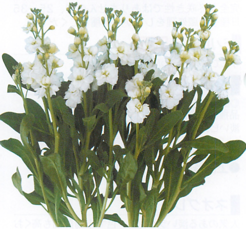
シャンテ ホワイト 品種登録第16802号 (PVP)