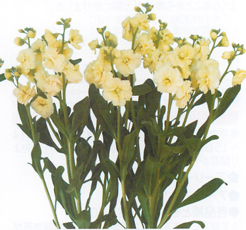
シャンテ イエロー 品種登録第16803号 (PVP)