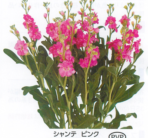
シャンテ ピンク 品種登録第16804号 (PVP)