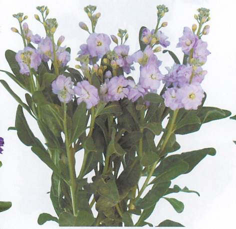
シャンテ ラベンダー 品種登録第16800号 (PVP)