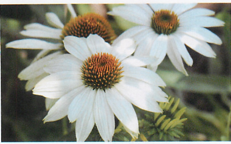
パウワウ ホワイト