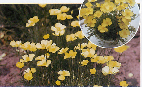
ミニチュアサンデュー