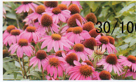
パウワウ ワイルドベリー