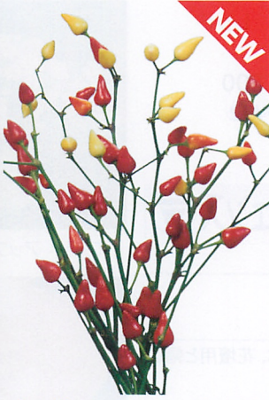
カッパー コーンホワイトレッド