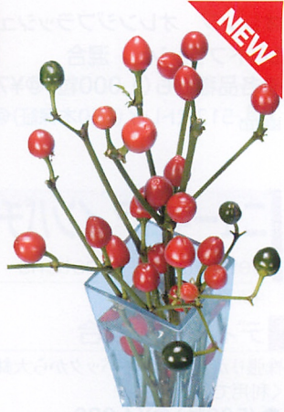
カッパー ラウンドレッド