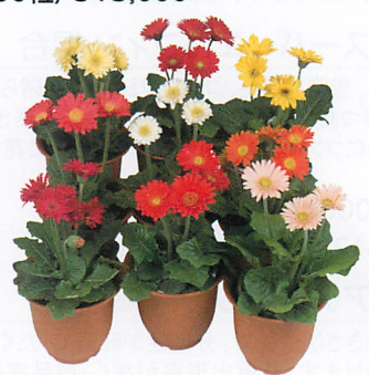
フロリポットマイクロ ミックス