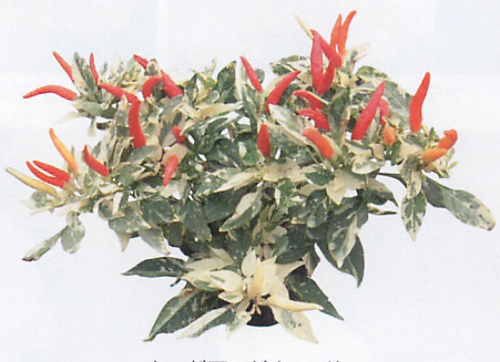
レッドアンドホワイト