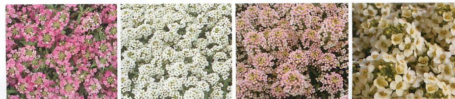
イースターボネット ディープピンク イースターボネット ホワイト イースターボネット ピーチ イースターボネット