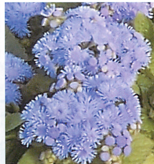
ブルーダニューブ