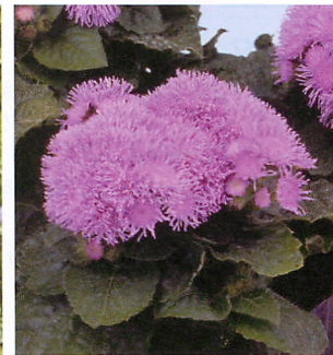
ダイヤモンドブルー