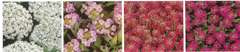
スノークリスタル イースターボネット ラベンダー イースターボネット ディープローズ イースターボネット バイオレット