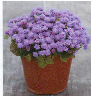
クラウドナイン ブルー