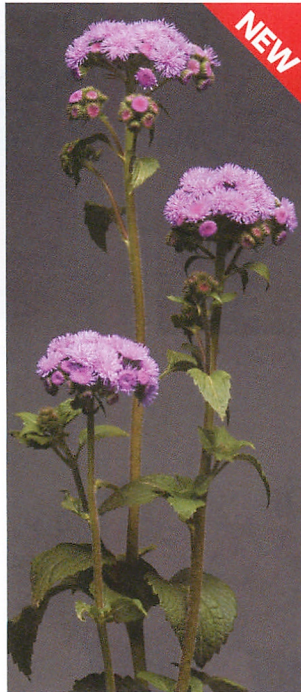
エベレストブルー