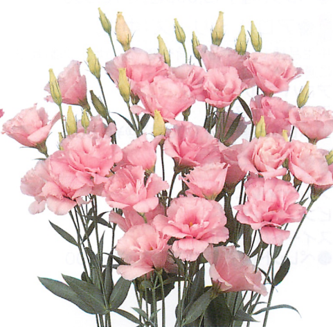
スーパープリマドンナ