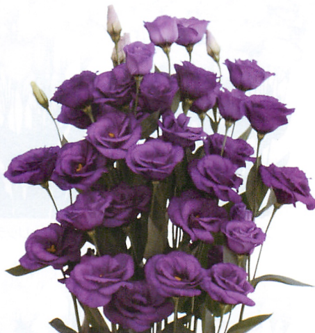
フィンオブナイト