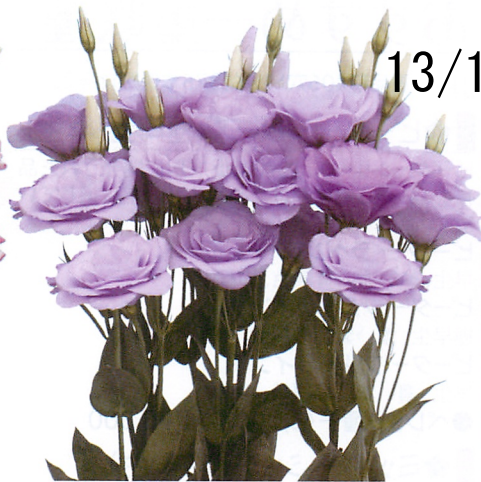
アンジュ ラベンダー