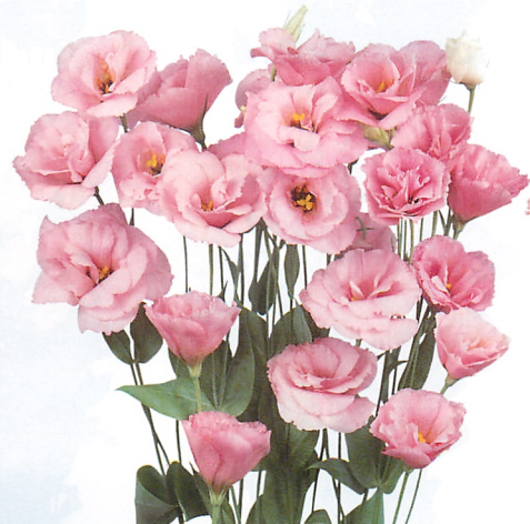
スーパープリマピンク