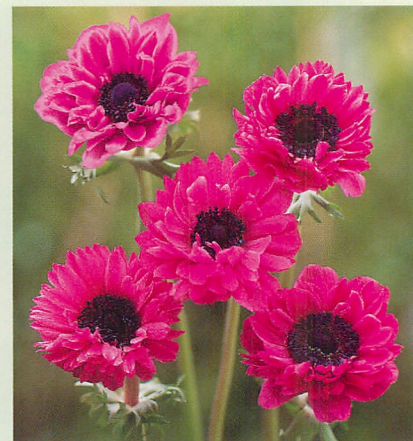
セントブリジット 桃色種