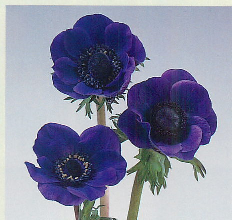
デ・カーン 青紫色種