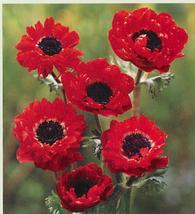
セントブリジット 赤色種