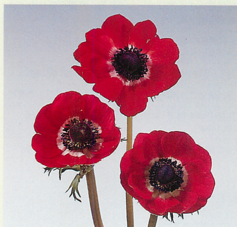
デ・カーン 赤色種