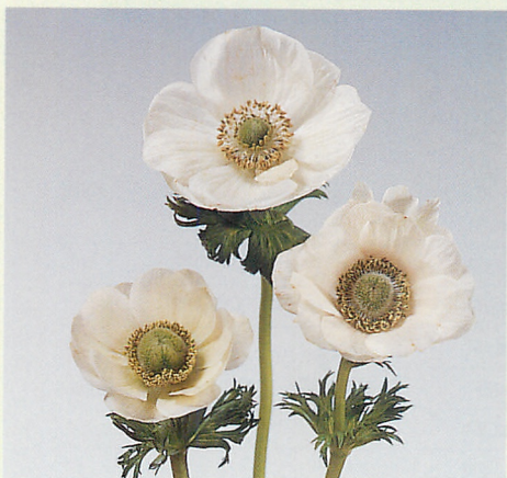
デ・カーン 白色種