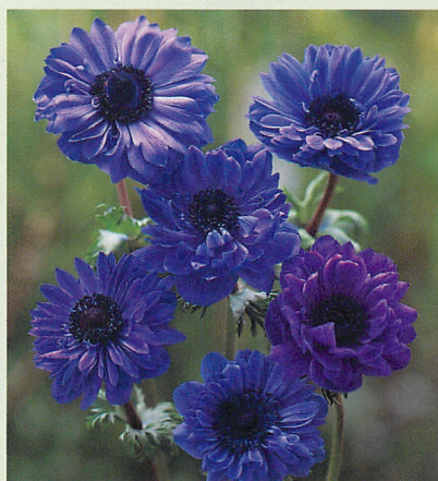
セントブリジット 青紫色種