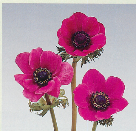
デ・カーン 桃色種