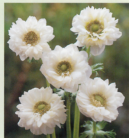
セントブリジット 白色種