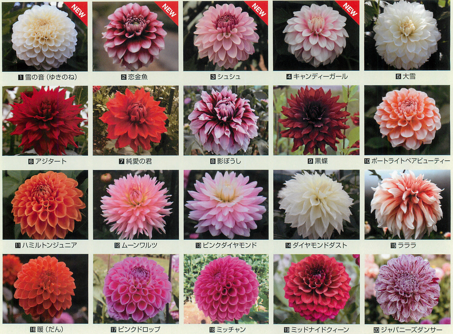
1 雪の音 (ゆきのね) 2 恋金魚 3 シュシュ 4 キャンディーガール 5 大雪 6 アジタート 7 純愛の君 8 影ぼうし 9 黒蝶 10 ポートライトペアビューティー 11 ハミルトンジュニア 12 ムーンワルツ 13 ピンクダイヤモンド 14 ダイヤモンドダスト 15 ラララ 16 暖 (だん) 17 ピンクドロップ 18 ミッチャン 19 ミッドナイドクィーン 20 ジャパニーズダンサー