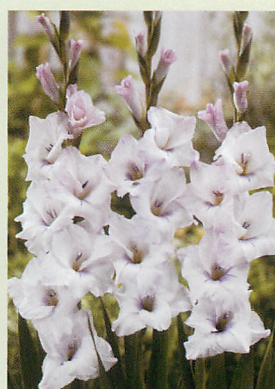
14 フレボスピリット® 薄ライラック