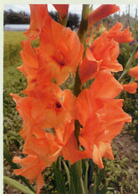
11 プリンソブオレンジ 橙