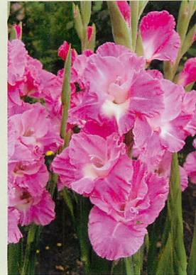
5 ピンクパーロット® 濃桃