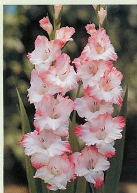
6 ピンクレディ® 白/濃桃