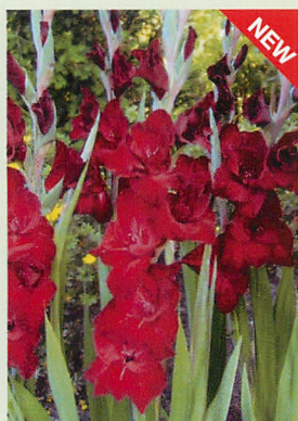
7 ファットボーイ® 黒赤