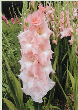
3 バンプ® 桃