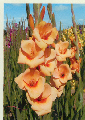
15 フレボビーチ® 橙