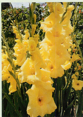
1 バナナラマ® 黄