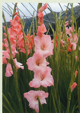
13 フレボエフェクト® 桃