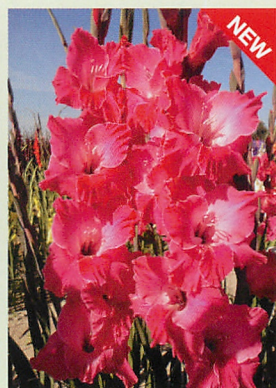
8 フェアリーテールピンク® 濃桃