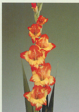
12 プリンセスマーガレットローズ 黄/赤