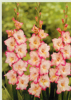
9 プリシラ 白/濃桃