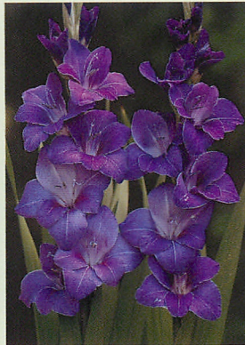
4 ビオレッタ® 紫