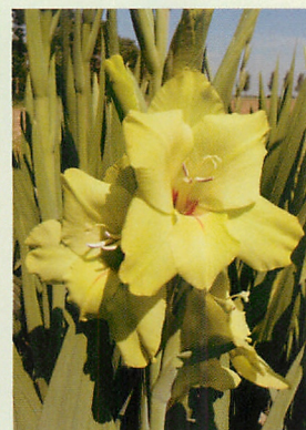
10 プリマヴェルデ 黄緑