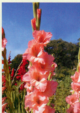
6 シュガーベイブ® 桃