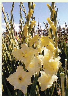
8 スピードデート® 薄黄