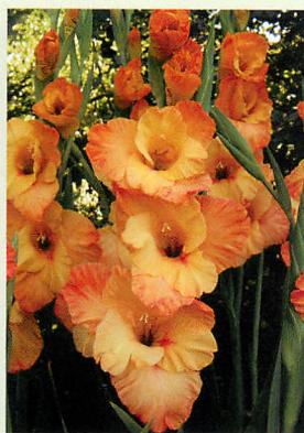
2 コパークウィン® 橙