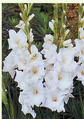
9 ソフィー® 白