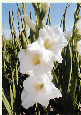
14 ノバゼンブラ® 白