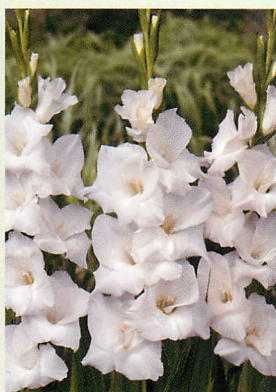
7 スノードン 白