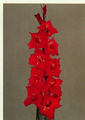
10 チノン® 赤