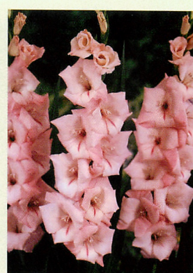
5 シマロサ® 桃