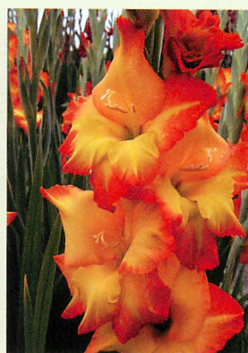
3 サンシャイン® 黄/橙