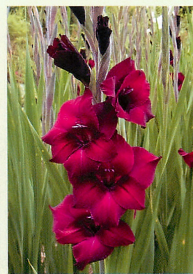
15 バックスター® 黒赤