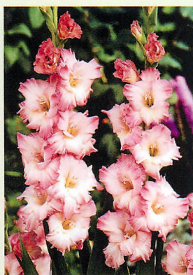
12 ドルチェビタ® 桃/白