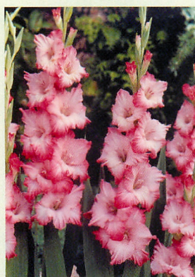
11 チョップス® 桃/白