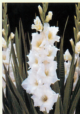
13 ニューウェーブ® 白