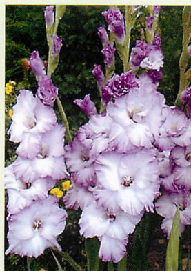
1 コスタ® 薄紫