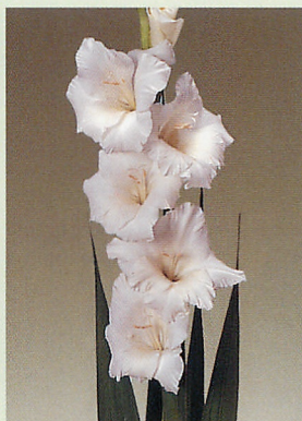
9 グランプリ® 白