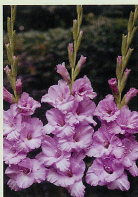
3 アルファ® ライラック