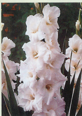
4 エssenシャル® 白