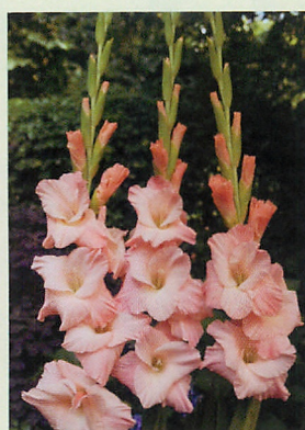
2 アリファナ® サーモンピンク