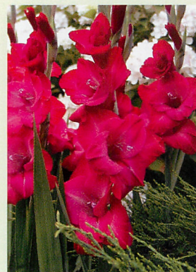
6 カシス® 赤