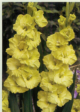
10 グリーンスター® 黄緑