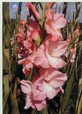
7 カルマ® サーモンピンク