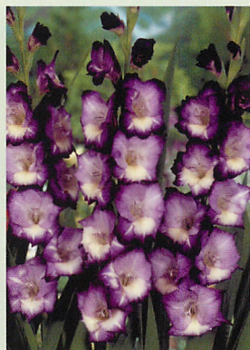
8 キングスリン® 紫/白