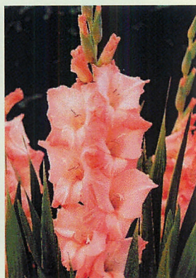
5 オアシス® サーモンピンク