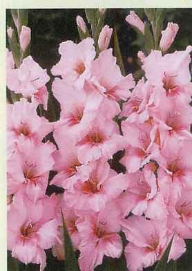
1 アドレナリン® 桃

※ご注文の際は球根サイズをご指示ください。 ※球根入数は異なる場合がございますので、ご照会ください。