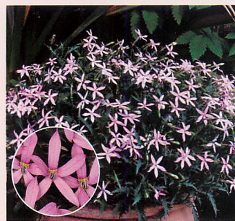
F1アバンギャルド ピンク