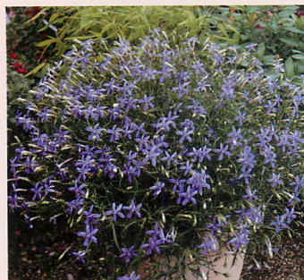
F1アバンギャルド バイオレット