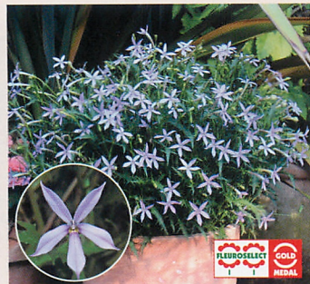
F1アバンギャルド ブルー