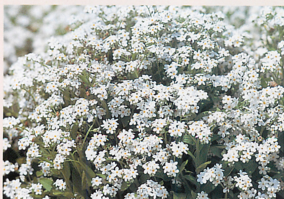
ドワーフ ホワイト