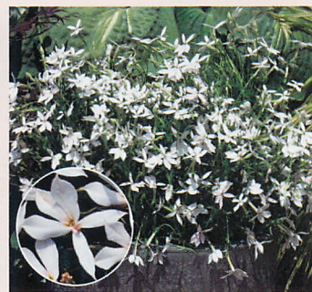
F1アバンギャルド ホワイト