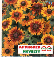
トトラスティック