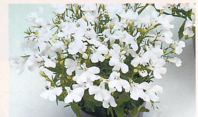
5 アクア ホワイト