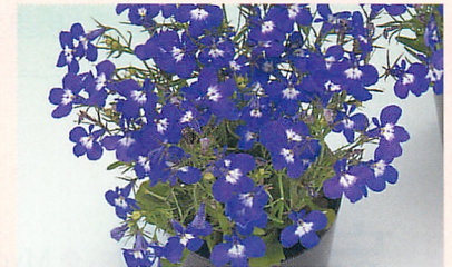
2 アクア ブルーアイ