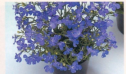
3 アクア スカイブルー