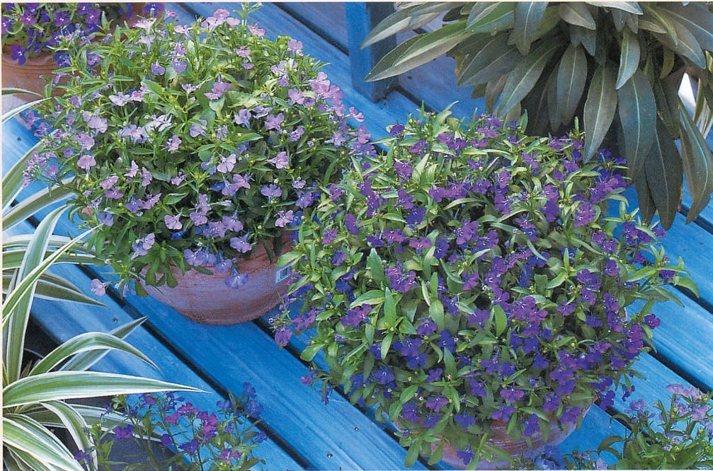
1 アクア ラベンダー (左) と 4 アクア ブルー (右)

早春出荷で特性を発揮。早生で株がよりコンパクトにまとまる。(在来種よりも7~10日程度開花が早い。草丈10~15cm程度) ※秋出荷型の栽培では株が徒長することがあるので、矮化剤処理が効果的。