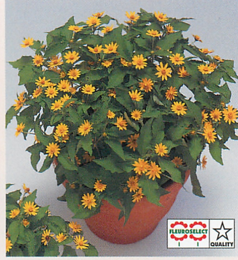
ミリオンゴールド