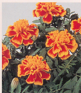
5 ボナンザ ビー