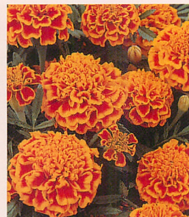
3 ボナンザ フレーム