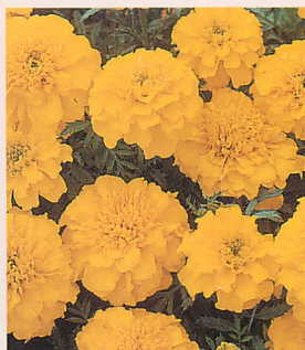
2 ボナンザ イエロー