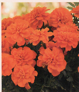
1 ボナンザ ディープオレンジ