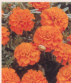
4 ボナンザ オレンジ