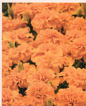
リトルヒーロー オレンジ