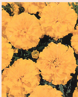
リトルヒーロー イエロー

価格(尾付種子) 20ml 400円 (税込432円) 1cl 1,300円 (税込1,404円) 1cl×10 11,000円 (税込11,880円) (10ml種子粒数: 250~500粒)