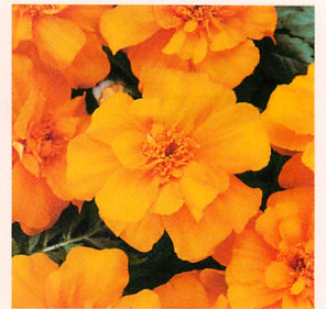
6 デュランゴ オレンジ