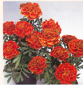
1 サファリ スカーレット

価格(尾付種子) 20mℓ 400円 (税込432円) 1dl 1,300円 (税込1,404円) 1ℓ 12,000円 (税込12,960円) (10mℓ種子粒数: 150~300粒)