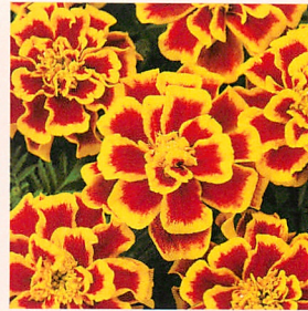
2 デュランゴ ビー