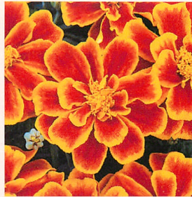
4 デュランゴ フレーム