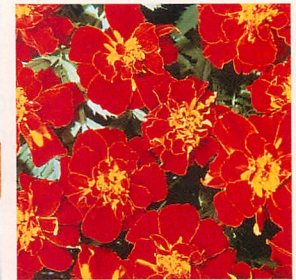
6 サファリ レッド