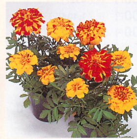
2 サファリ ポレロ