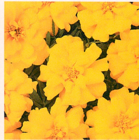
5 デュランゴ ゴールド