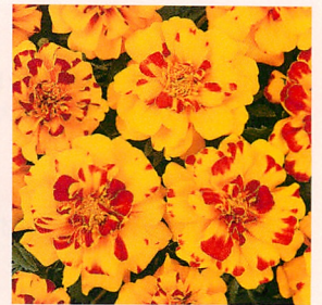
3 デュランゴ ポレロ