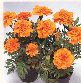
4 サファリ オレンジ