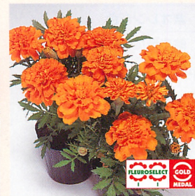
5 サファリ タンジェリン