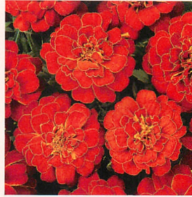
1 デュランゴ レッド