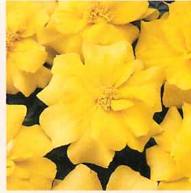
8 デュランゴ イエロー