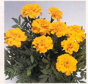
3 サファリ イエロー