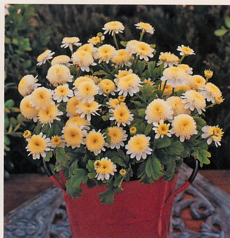
サンタナ イエロー