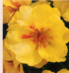
7 F1ハッピーアワー レモン