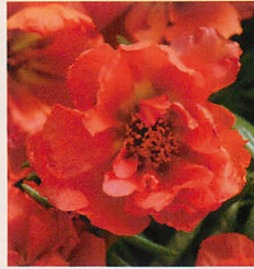
1 F1ハッピーアワー オレンジ