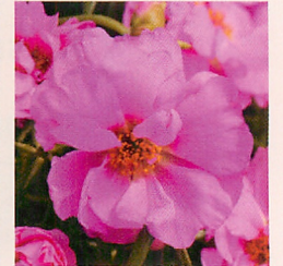
8 F1ハッピーアワー ロジータ