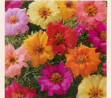
9 終日咲き 混合

価格 1ml 300円 (税込324円) 10ml 2,700円 (税込2,916円) (1ml種子粒数:約5,000粒)