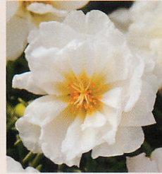
2 F1ハッピーアワー ココナツ