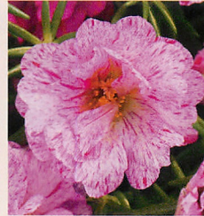
6 F1ハッピーアワー ペパーミント