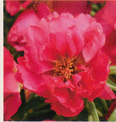
5 F1ハッピーアワー フクシア