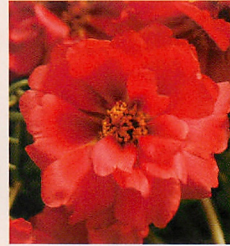
3 F1ハッピーアワー ディーブレッド