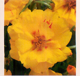
4 F1ハッピーアワー パナナ