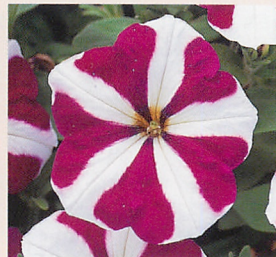
10 F 1 ロンド バーガンディスター