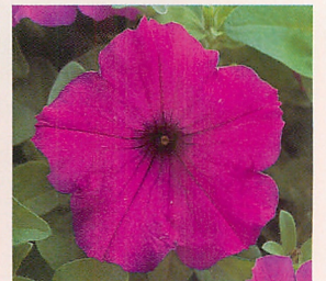
7 F 1 ロンド パープル