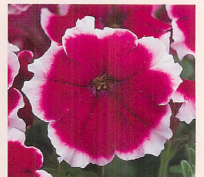
12 F 1 ロンド バーガンディビコティ