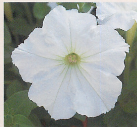
5 F 1 ロンド ホワイトインブ