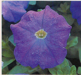
8 F 1 ロンド ライトブルー