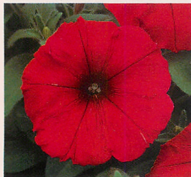
3 F 1 ロンド レッド