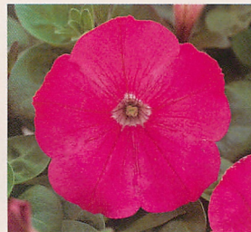
6 F 1 ロンド ディープローズ