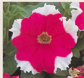
11 F 1 ロンド ローズビコティ