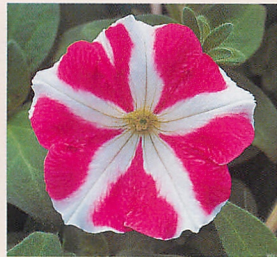
9 F 1 ロンド ローズスター