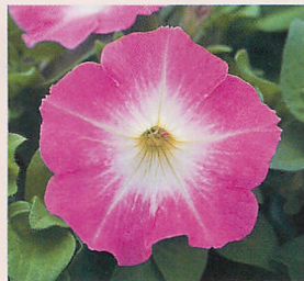
4 F 1 ロンド ローズモーン