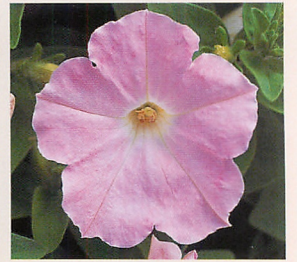
2 F 1 ロンド ピンクインブ