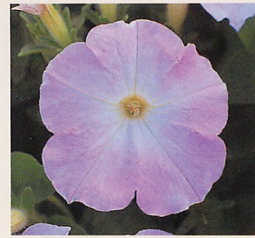
1 F 1 ロンド ローズピンク