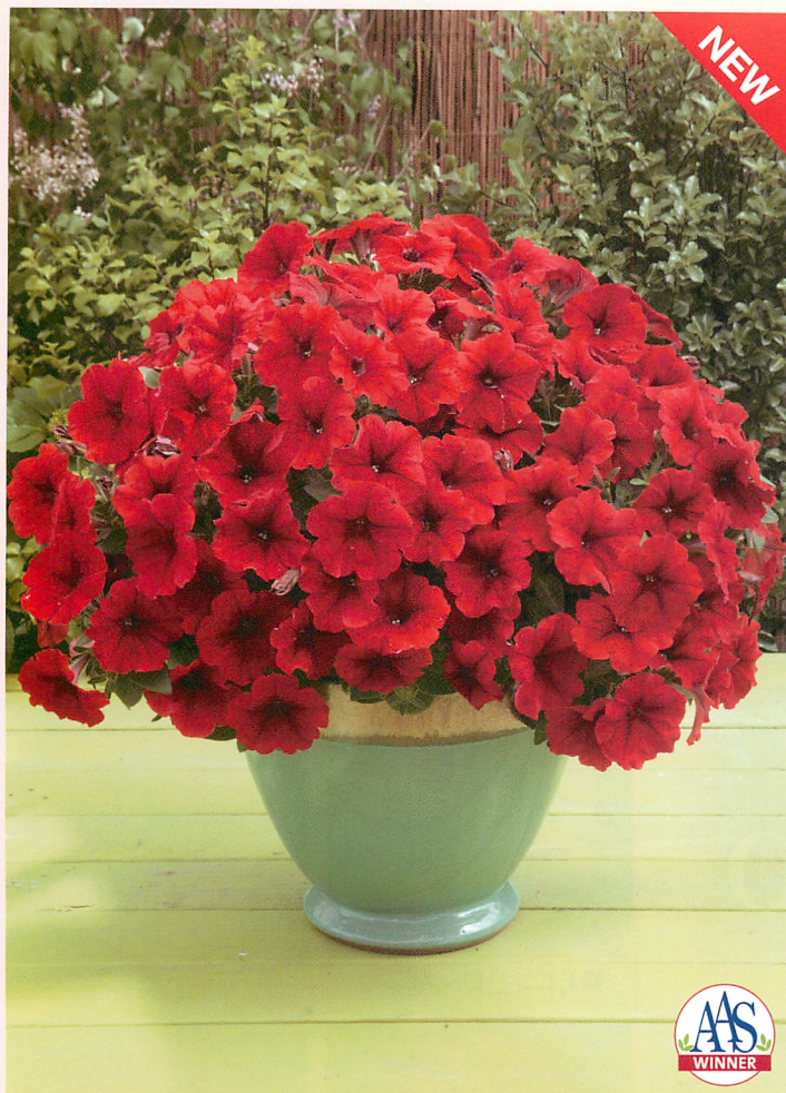
1 F 1 ディーバ レッド (TX-705)