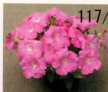
5 F 1 ディーバ ローズ