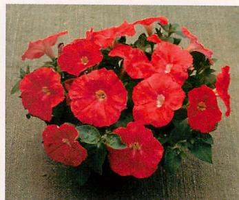
6 F 1 ディーバ スカーレット