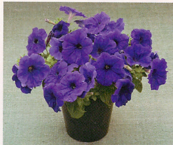
3 F 1 ディーバ トゥループブルー