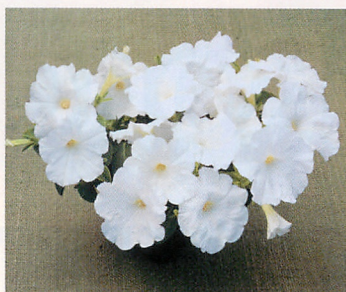
4 F 1 ディーバ ホワイト