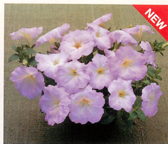
2 F 1 ディーバ ラベンダーピンク (TX-676)