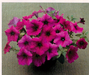
7 F 1 ディーバ パープル