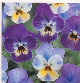
28 Fiビビ フェイシーズ