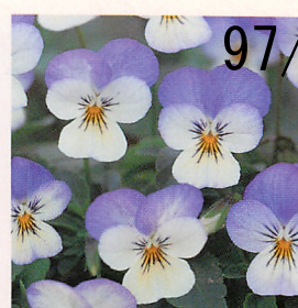
25 Fiビビ スパークブルー