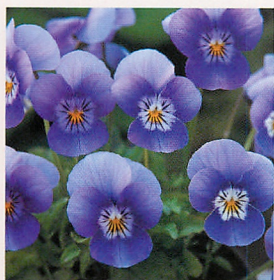
27 Fiビビ ブルーフェイス