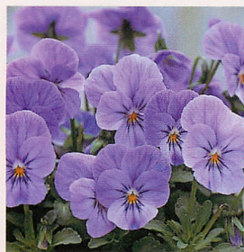
26 Fiビビ ラベンダーシェード