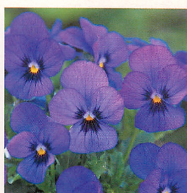
24 Fiビビ サファイアウィズブロッツ