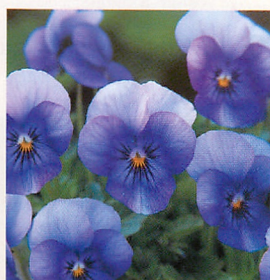
23 Fiビビ アイスブルー