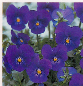
21 Fiビビ パープル