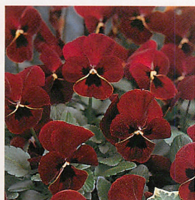
22 Fiビビ レッドウィズブロッツ